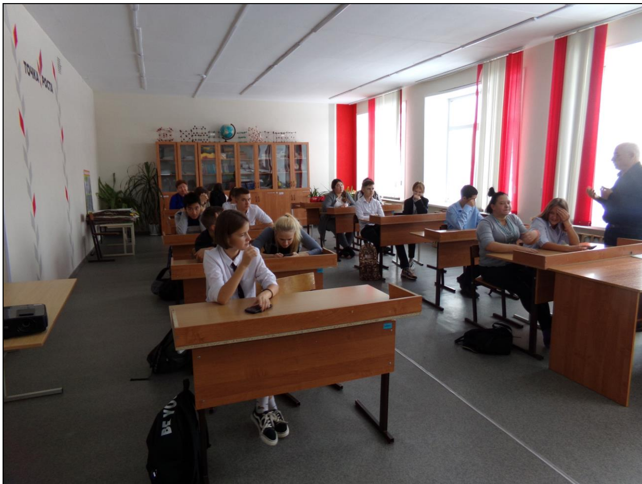
Во время занятия – 12.11.2021