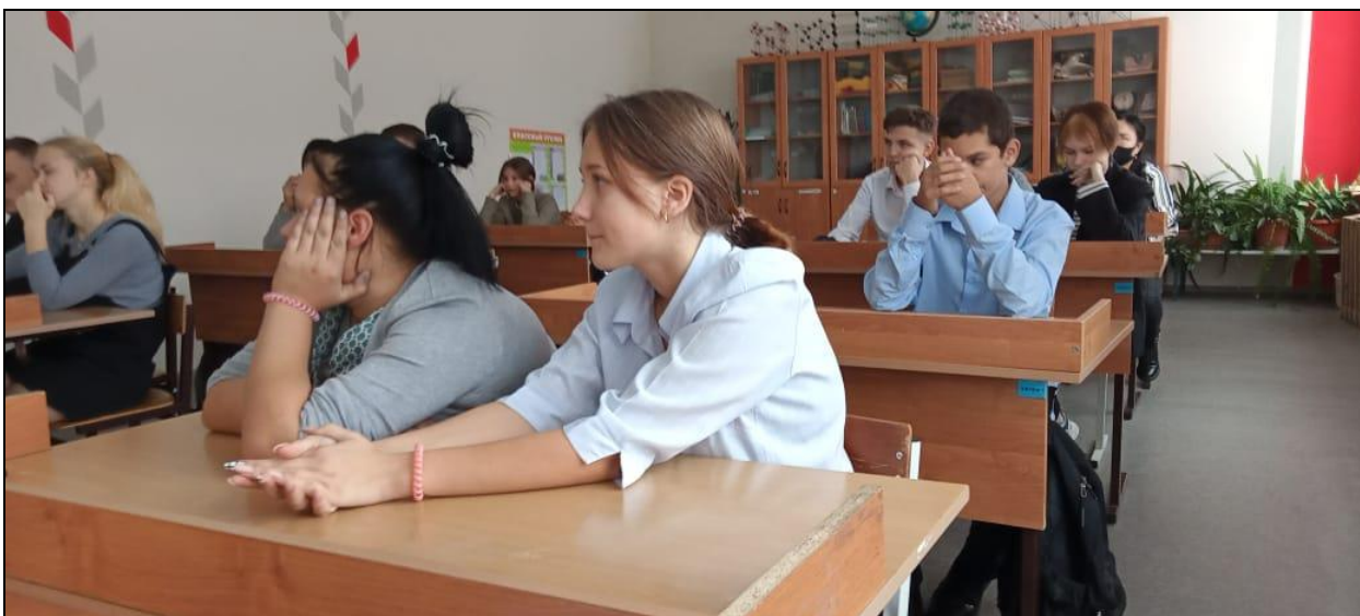
Ученики слушают лекцию – 12.11.2021