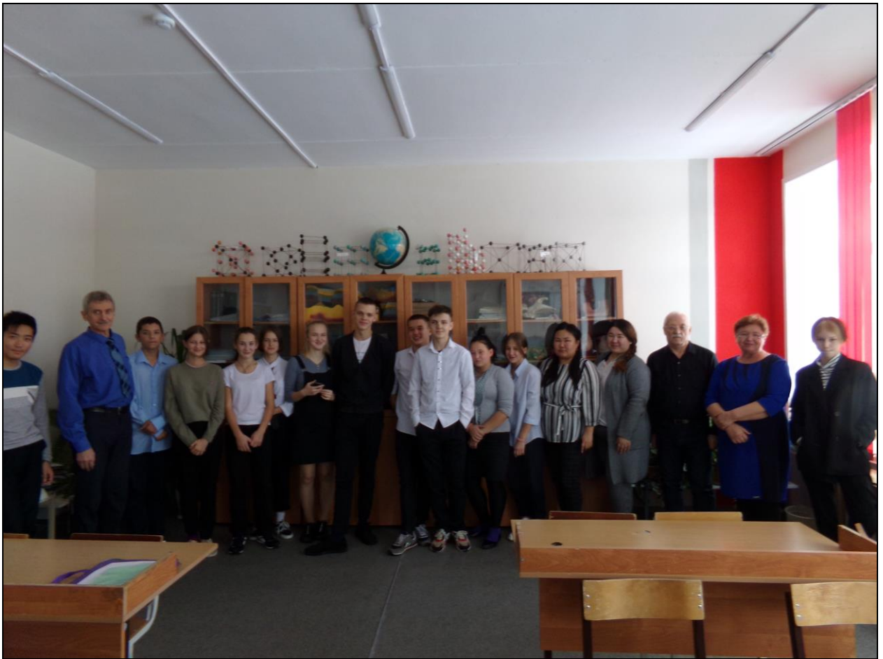
С учителями и школьниками с. Малышево – 12.11.2021