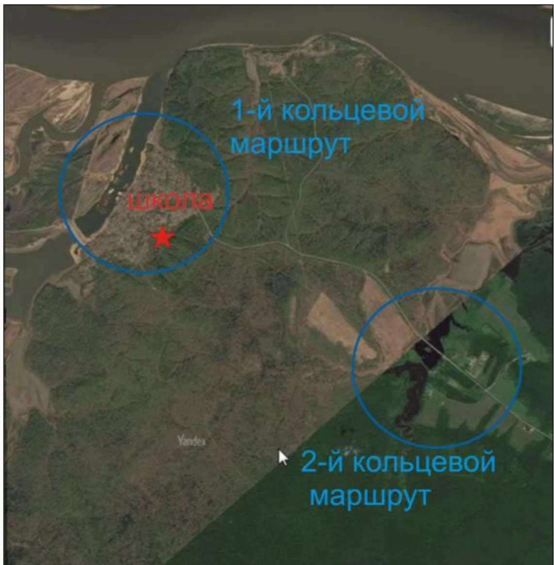
Схема кольцевых маршрутов в районе Малышевского сельского поселения (1-й – район с. Малышево, 2-й – район с. Чернолесье)