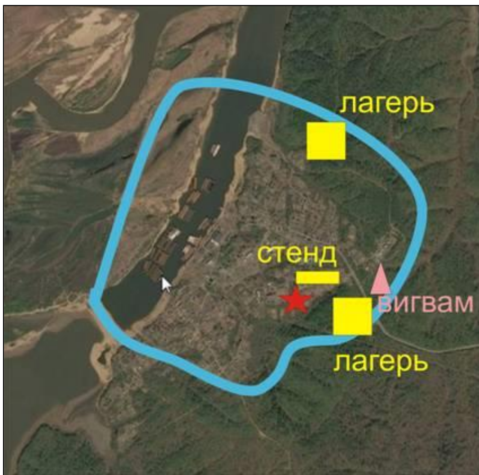
Подробная схема экологического маршрута в районе с. Малышево