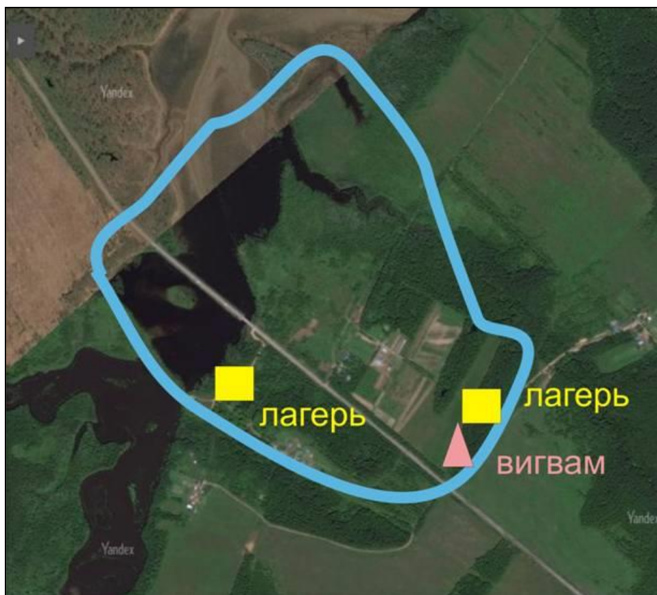
Подробная схема экологического маршрута в районе с. Чернолесье